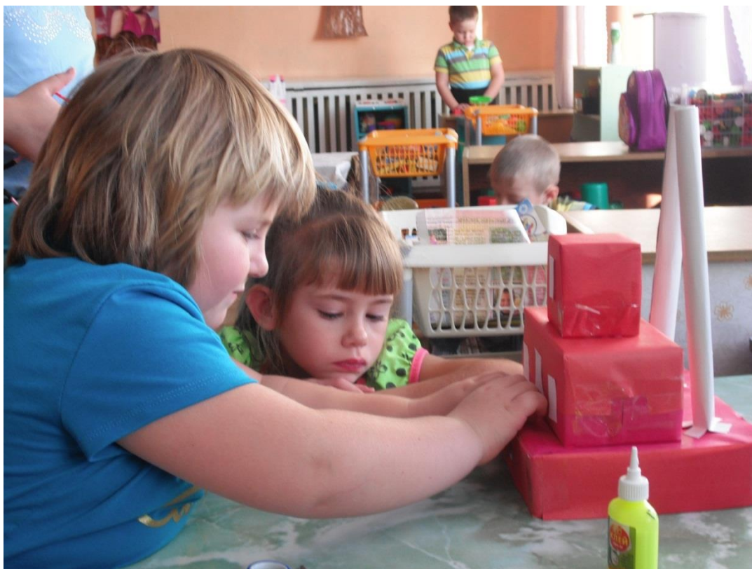
Завод который не дымит.

Воспитатель: Ребята, поговорите с родителями сегодня вечером, с родителями, спросите, что они делают для сохранения природы в нашем посёлке. На следующей нашей встрече мы решим надо ли ставить рядом с названием нашего посёлка значок SOS .