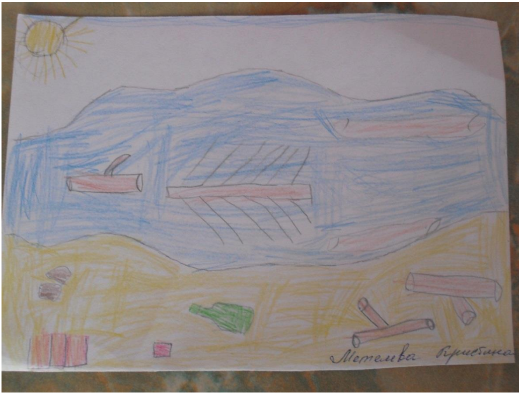
Весной плывут бревна, и оставшийся мусор на берегу .