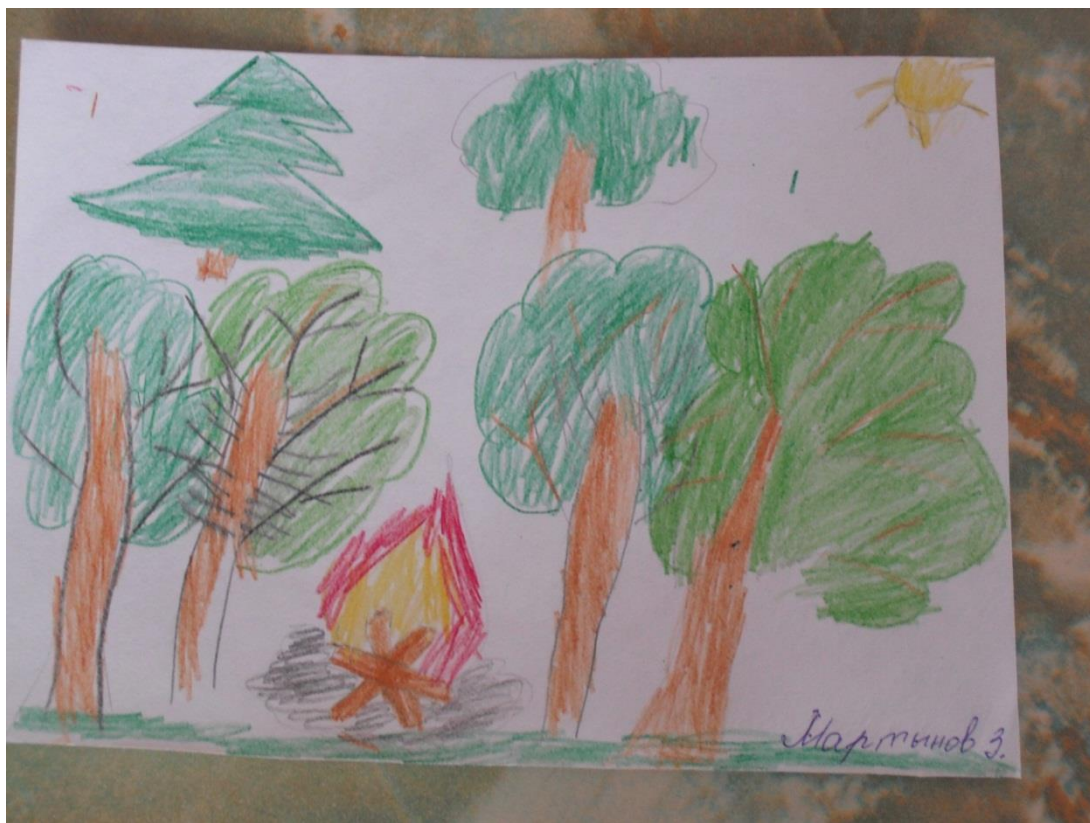
Разжигают костры в лесу и оставляют за собой мусор.