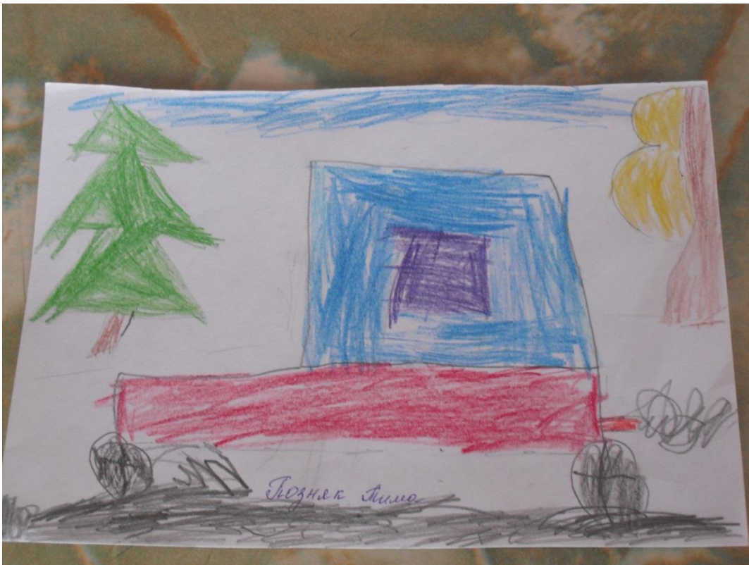
Машины загрязняют воздух своим дымом.